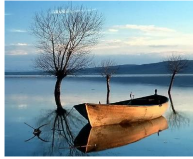
图 1 xxxxx 图

图题小五号楷体，固定行距 12 磅，段后 6 磅，表中文字均为 6 号字，行距为单倍行距。图片较小时直接插入图片，界面截图的清晰度参照如图 1 所示。